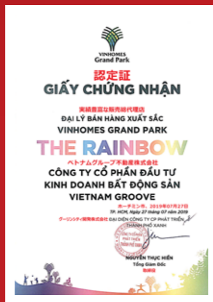
ザ・レインボーの正規代理店の証明書