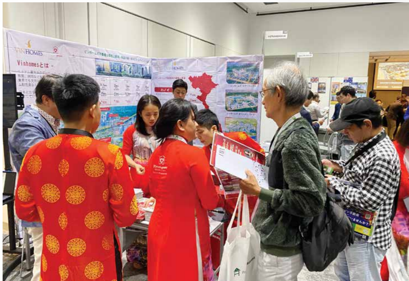
画像:日本で開催された国際不動産展示会