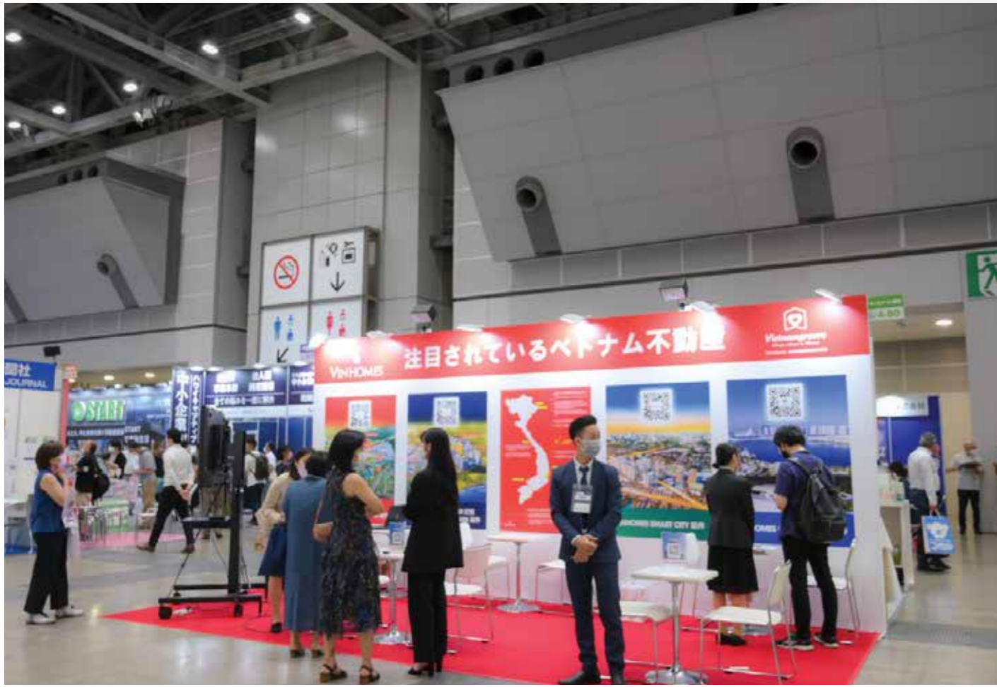
画像:日本で開催された国際不動産展示会