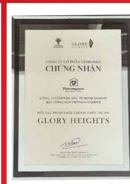
グローリー・ハイツの正規代理店の証明書