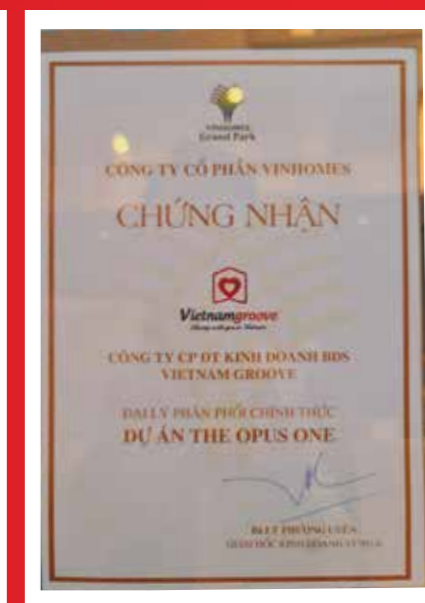
オーパス・ワン区画の正規総代理店