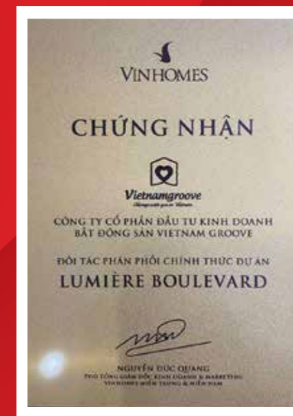
ルミエール・ブルーバードの正規代理店の証明書