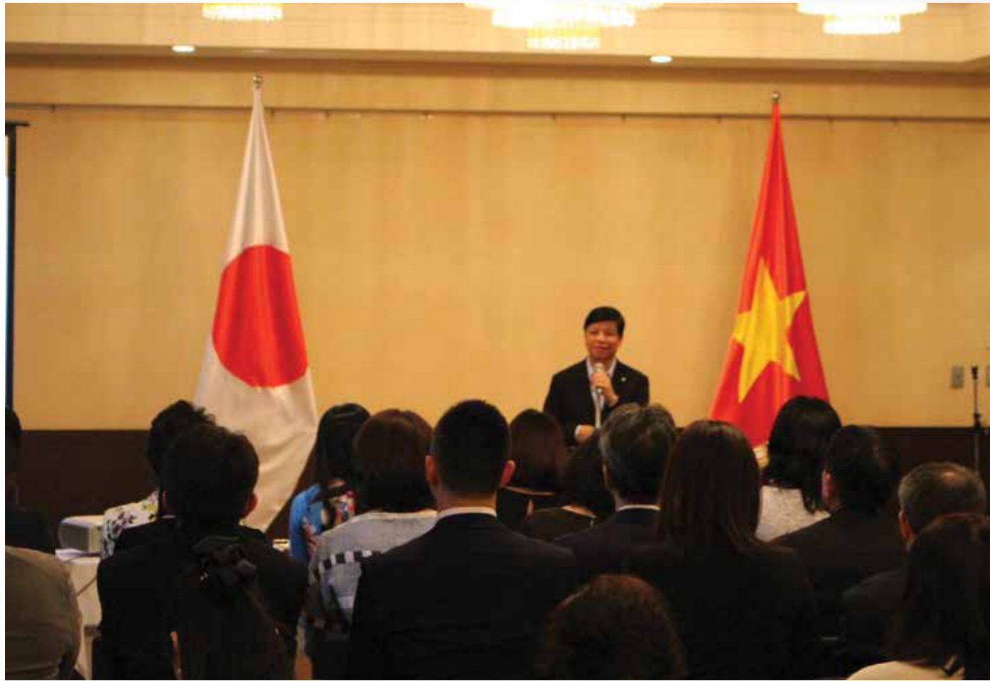
写真:グエン・コック・クオン駐日ベトナム特命全権大使が歓迎の挨拶を行いました。