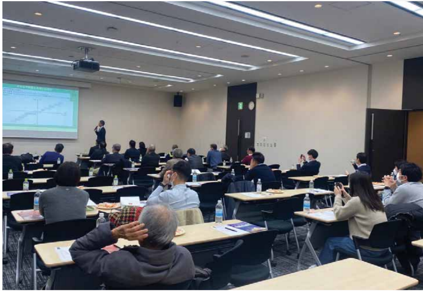
画像:日本で開催されたベトナム不動産セミナー