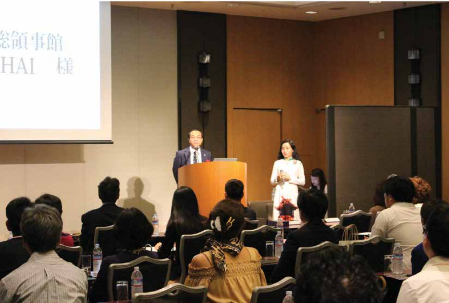
ベトナム総領事館は、お客様を歓迎するスピーチを行いました。