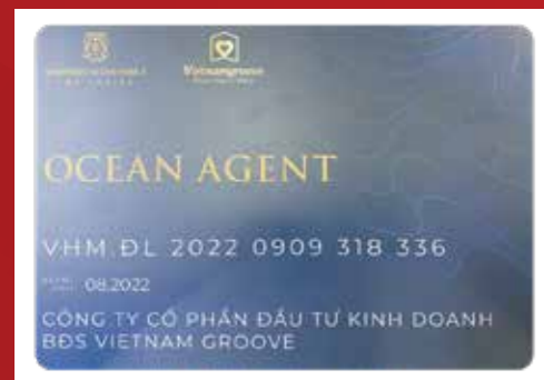
ヴィンホームズ・オーシャンパーク2の正規代理店の証明書