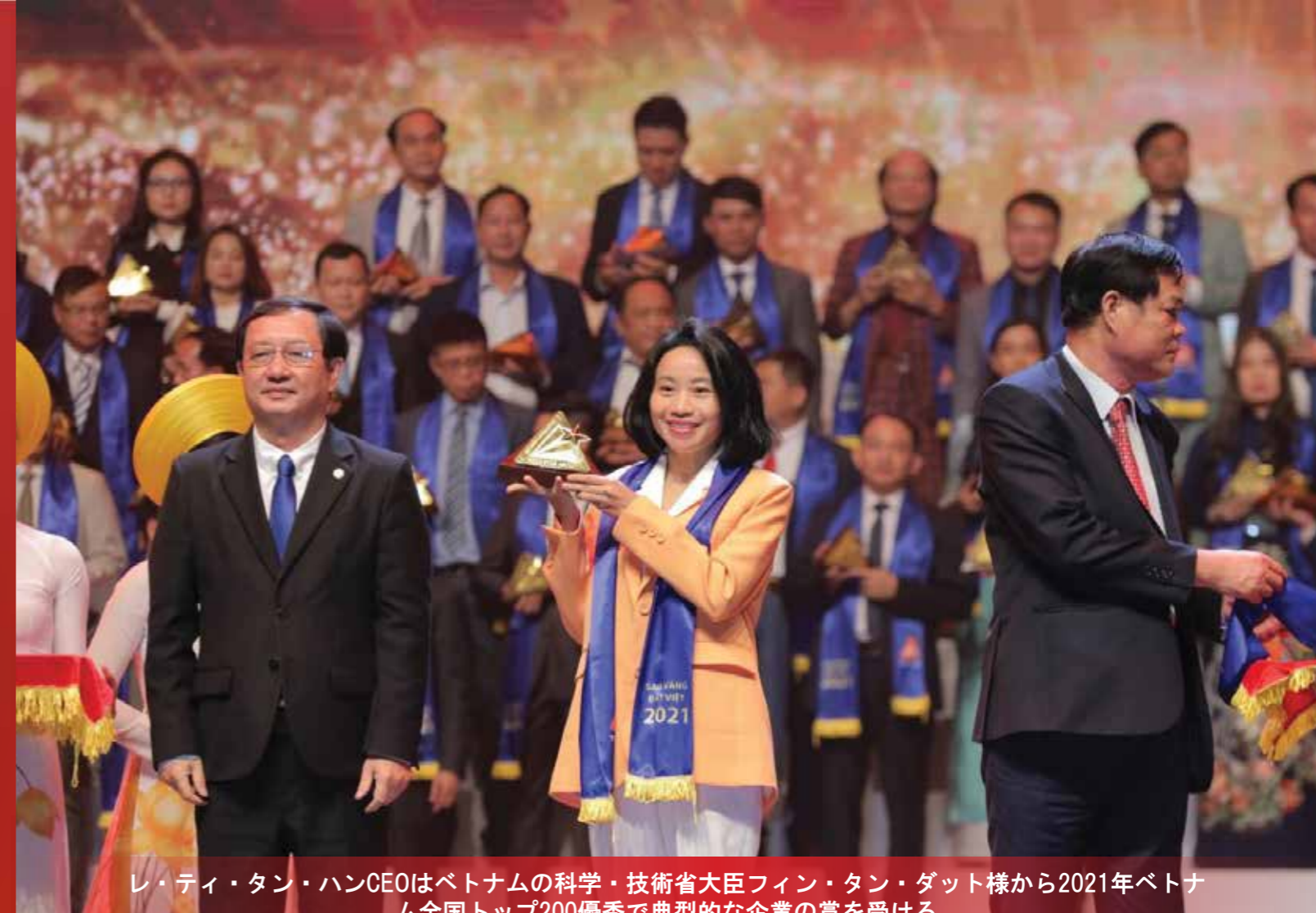
レ・ティ・タン・ハンCEOはベトナムの科学・技術省大臣フィン・タン・ダット様から2021年ベトナム全国トップ200優秀で典型的な企業の賞を受ける