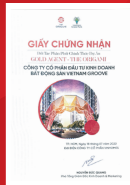
ザ・オリガミの正規代理店の証明書