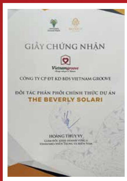
ザ・ビバリーソラーリの正規代理店の証明書