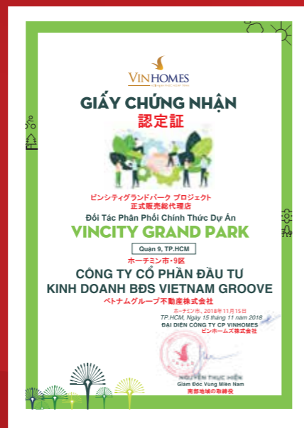
ヴィンホームズ・グランドパークの正規代理店の証明書