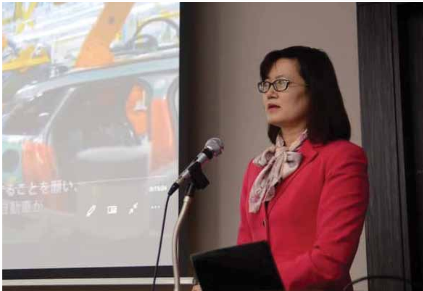
写真:ラム・ティ・タン・フォン駐日ベトナム大使が会議の開始を歓迎するスピーチを行いました。