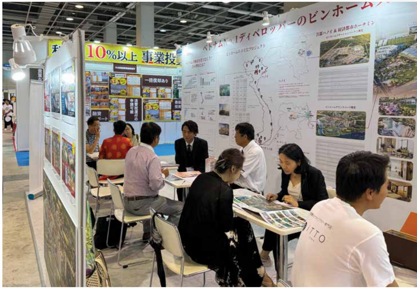
画像:日本で開催された国際不動産展示会