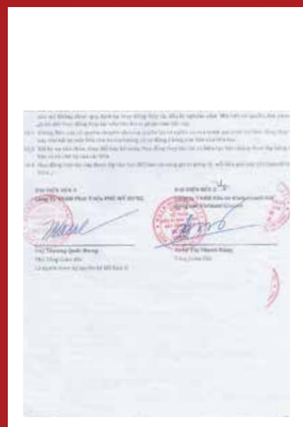
フォーミーパークの正規代理店の証明書